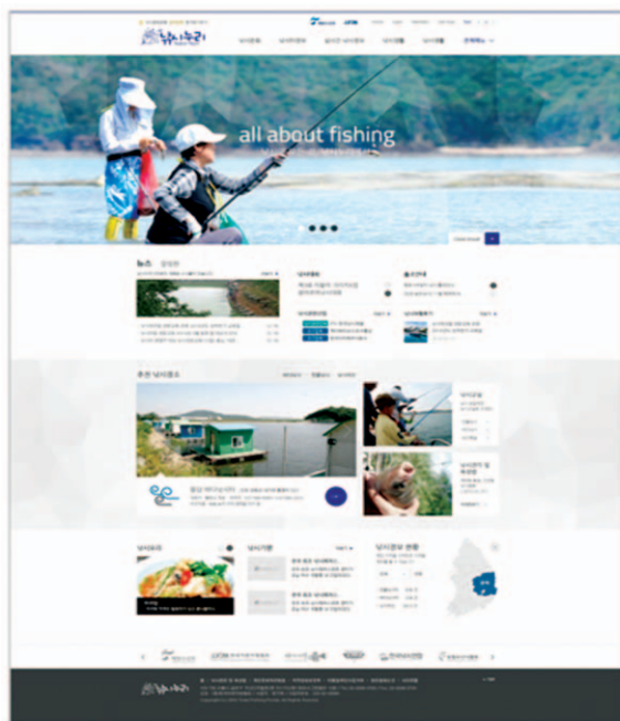
〈포털 메인 화면〉

낙시누리 포털의 특징은 민간 낙시 사이트와 차별화된 포털로 건전한 낙시문화 캠페인, 낙시 법률 및 정책과 자원회복프로그램 홍보 등을 통한 공공성을 정립하고, 지자체에 등록, 허가, 신고된 낙시터 및 낙시어선 정보만을 제공하여 신뢰성을 향상시키는데 중점을 두었다. 또한 시설 중심으로부터 매체중심의 낙시산업 활성화로 전환, 체험관광 수요 증대 대응, 낙시산업에 대한 허브포털로서의 기능, 마지막으로 농어촌 주민의 소득향상에 기여하는 목적으로 구축되었다.