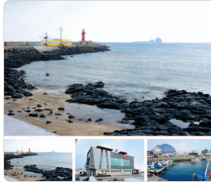
<바다낚시터 메인 화면>