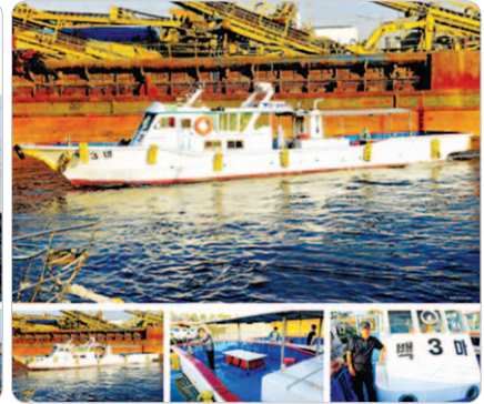
<낚시어선 메인 화면>

그 외 붕어낚시첫걸음(민물편), 원색낚시채비대백과(바다편) 등 낚시채비와 관련된 책자들을 콘텐츠로 구축하고 있어, 낚시를 처음 배우는 낚시인들도 많이 활용할 수 있는 정보를 제공하고 있다.