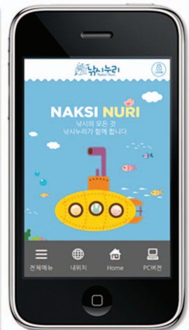
〈모바일 메인 화면〉