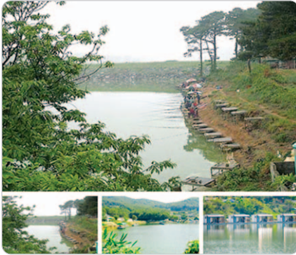
<민물낚시터 메인 화면>